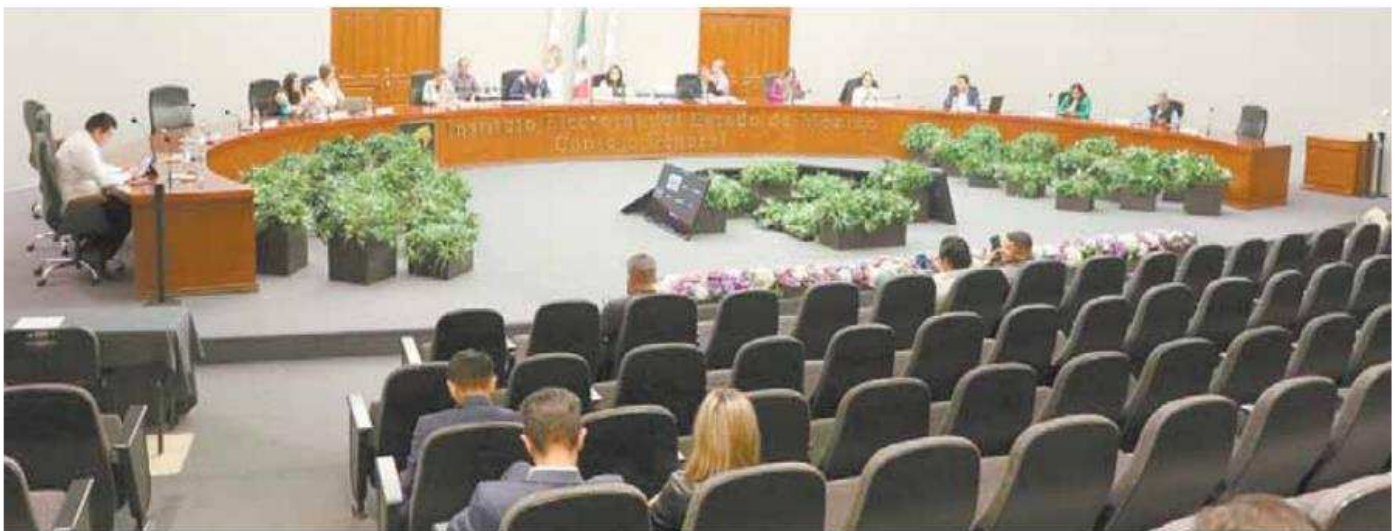
El Instituto Electoral del Estado de México preservó la integridad de las Juntas Distritales.