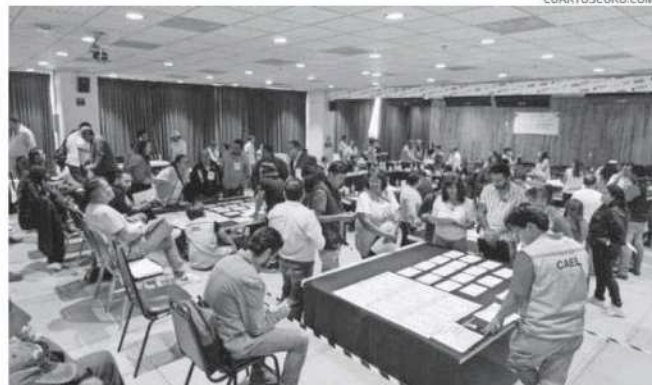
Les enviarán un equipo a Ecatepec, Toluca y Tlalnepantla para auxiliar en el conteo

Asimismo, Temoaya, Temascalcingo, Tenancingo, Tepetlaoxtoc, Tequixquiac, Texcoco, Tianguistenco, Tlatlaya, Tultepec, Villa del Carbón, Villa Guerrero, Zazcotonapan, Zacualpan, Zumpahuacán,